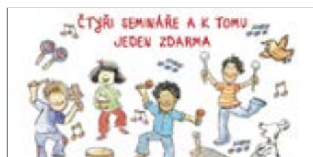
POUKAZ 4+1 ZDARMA Vstupné 10 000,- Kč