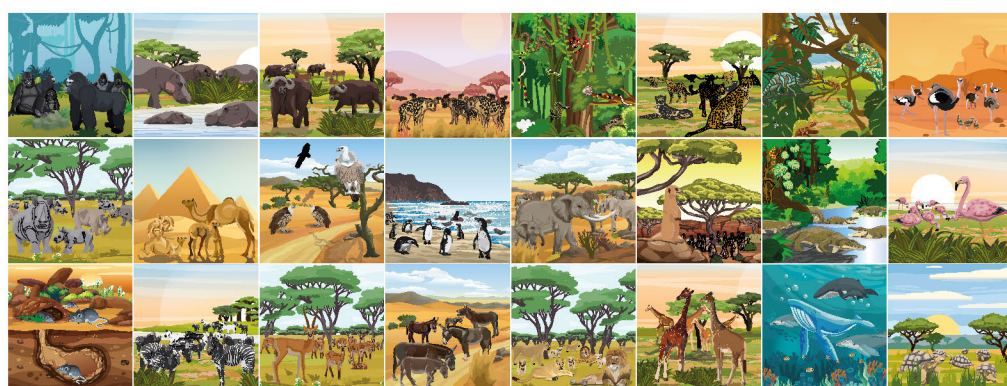
Příkladací čtverce na stanu 6 - Africká zvířata v přirozeném prostředí