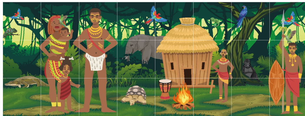
Strana 5 - Savany a stepi v jižní části Afriky