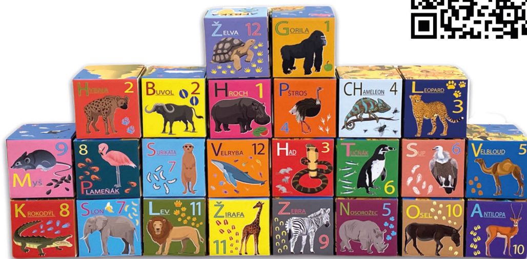
Strana 1 - Nejznámější africká zvířata

Samotná kostka Carton Cajon je perkusní nástroj, ale kostka jako součást sady Africké dovádění její způsob a frekvenci používání rozšiřuje. Doplnkové didaktické materiály, které jsou součástí sady, uvádí do práce s kostkami, obsahují hry, výtvarné aktivity, pracovní listy a podněty na podporu matematických a čtenářských pregramotnosti a kreativity. Práce s jednotlivými stranami kostek je pestrá a přesahuje samotný rámec hudebně-pohybových aktivit, např. se stranou vyobrazující jednotlivá zvířátka. Sestavené obrazce podněcují k rozhovorům s environmentální tematikou a pomáhají dětem poznávat svět v souvislostech. Jazykové varianty sady jsou CZ nebo SK, mění se názvy zvířat.